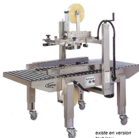
existe en version tout inox

***Largeur mini = 180mm si la machine est équipée d'une tête de 75mm